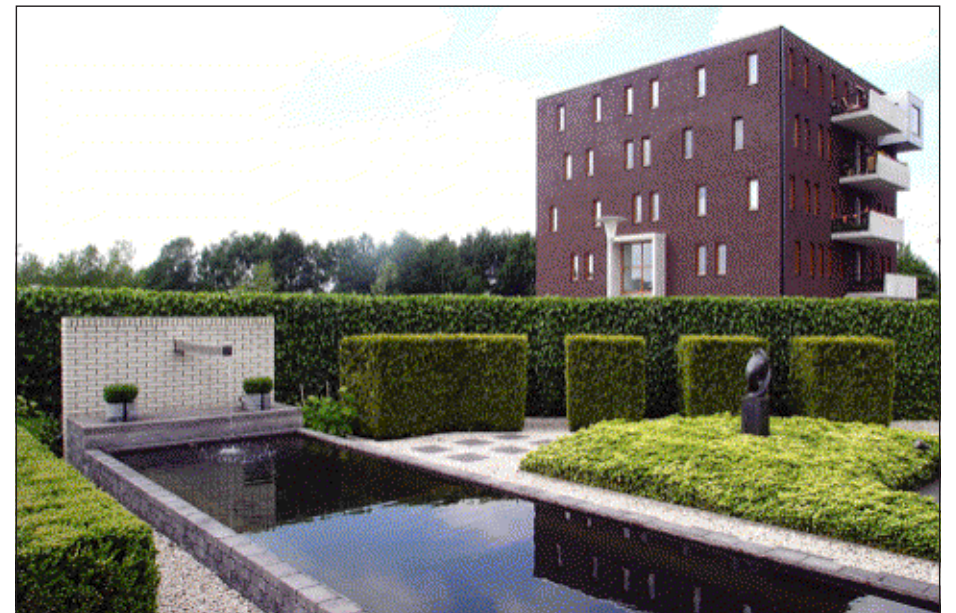
De tuin met kubusvormen sluit aan op de flat met geblokte uitstulpingen.