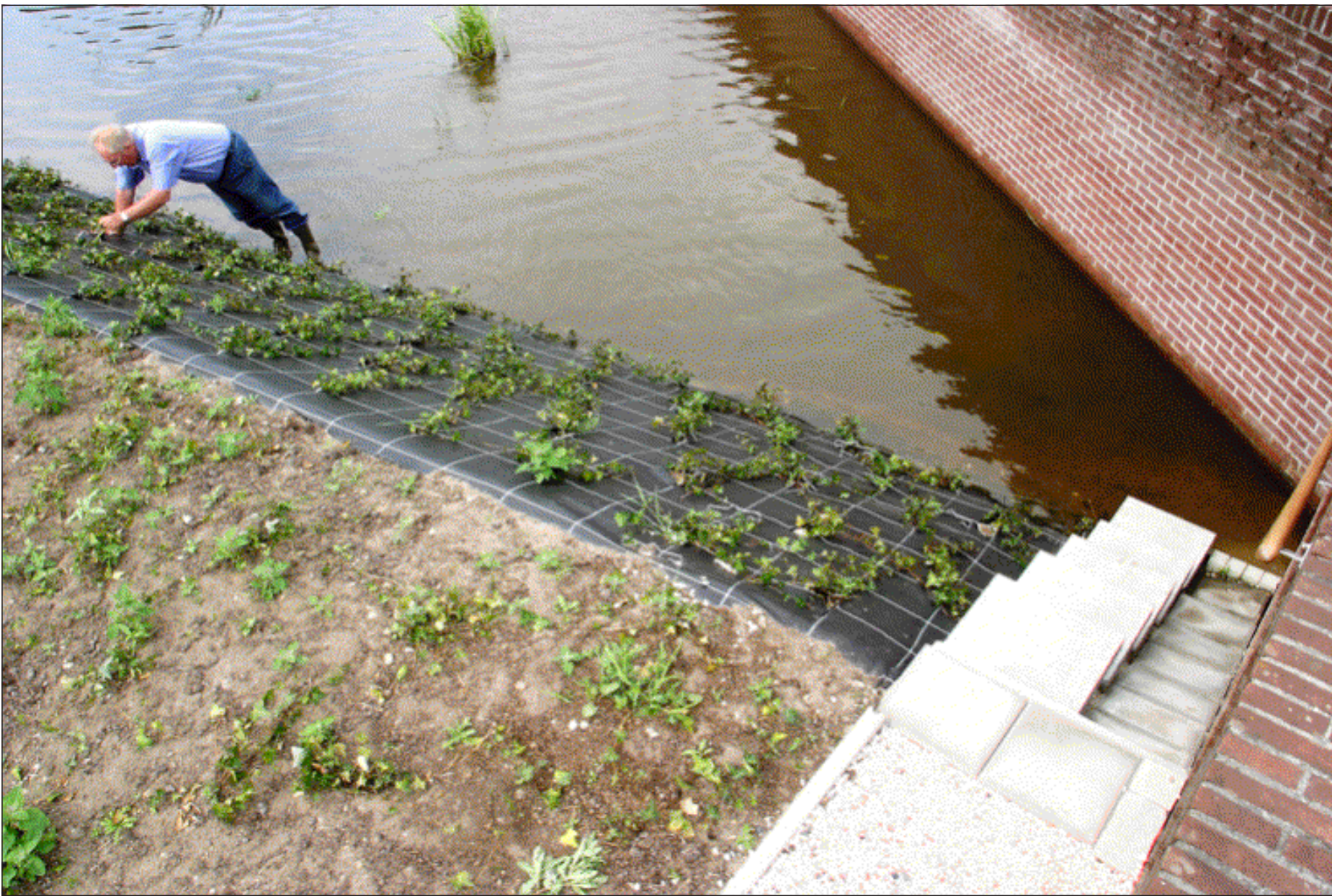
Harm Werkman schouwt de heder-aanplant vanuit de vijver. Rechts hebben de flatbewoners zelf een trap met leuning gemaakt.