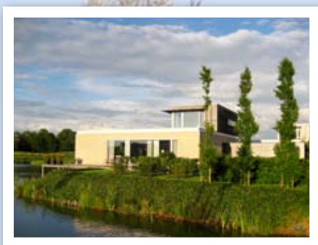
Omringd door de natuur.

'Alles wat natuur zo plezierig maakt, hebben we elke dag om ons heen'